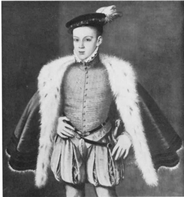
El Príncipe Don Carlos