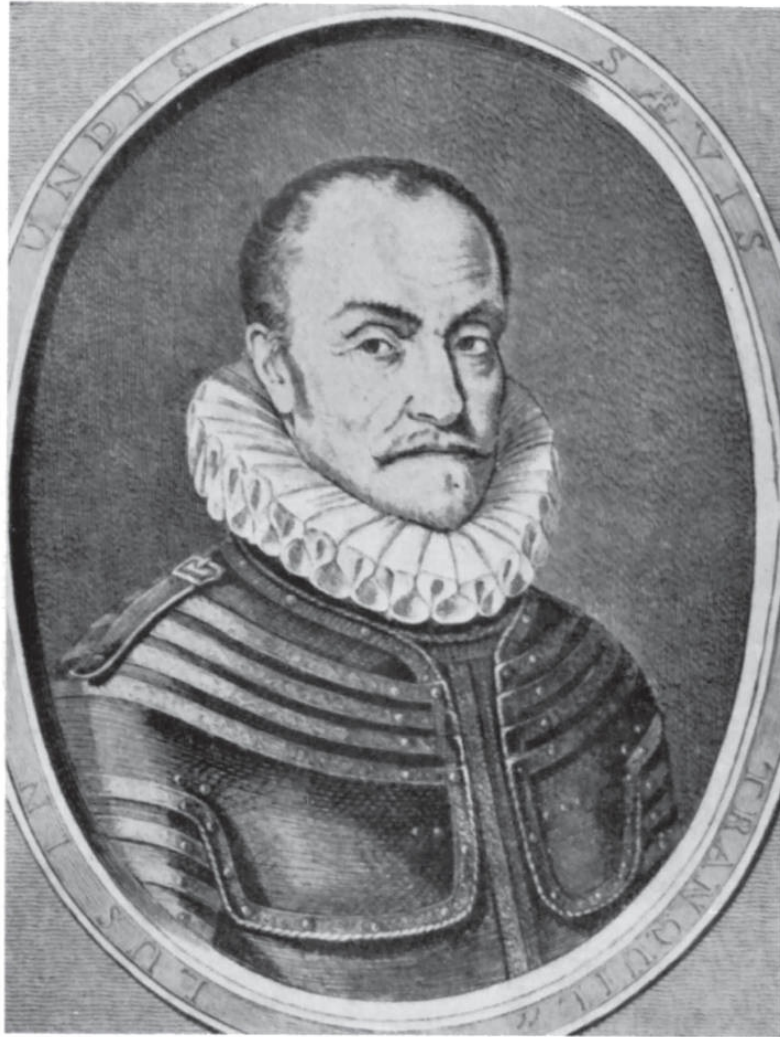
Guillermo de Orange