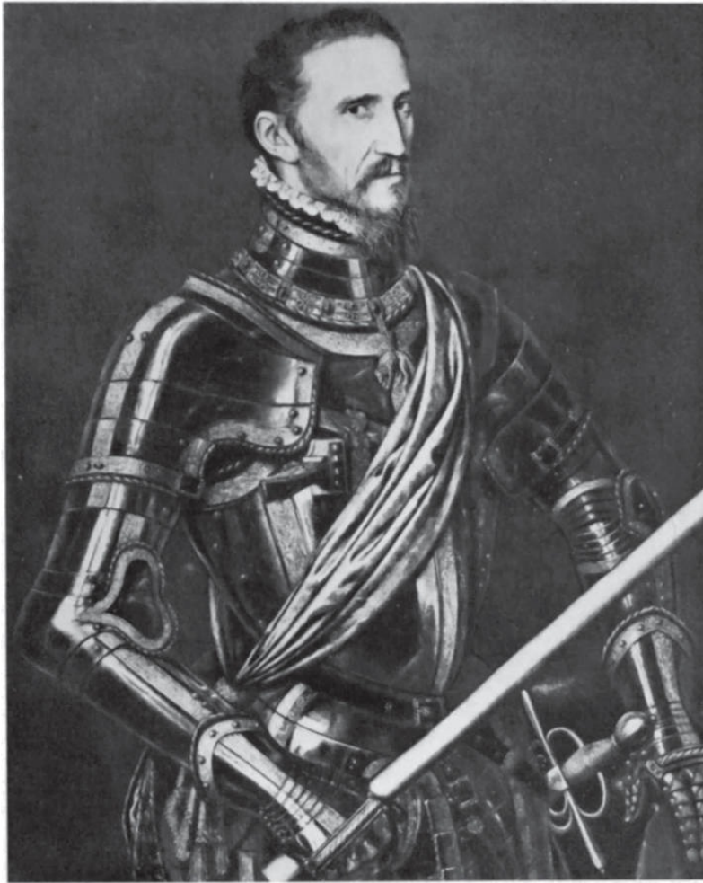
El Gran Duque de Alba